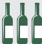
Vín 2,25 ltr.