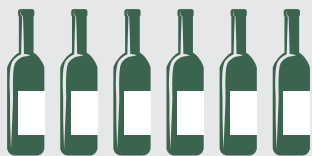
Vín 4,5 ltr.