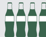
Sodavatn 10 ltr.